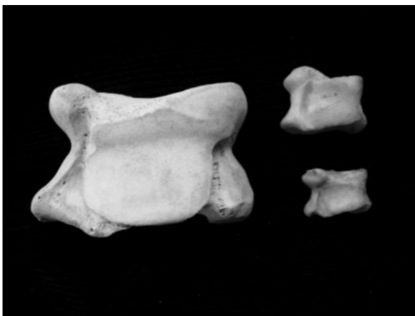
Tabas de vaca, oveja y cordero

Consultado un ilustre galeno confirmó que sin duda se trataba de un nuevo caso de síndrome de la menganita.