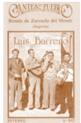
Portada de la grabación realizada en 1996 por Sonifolk.