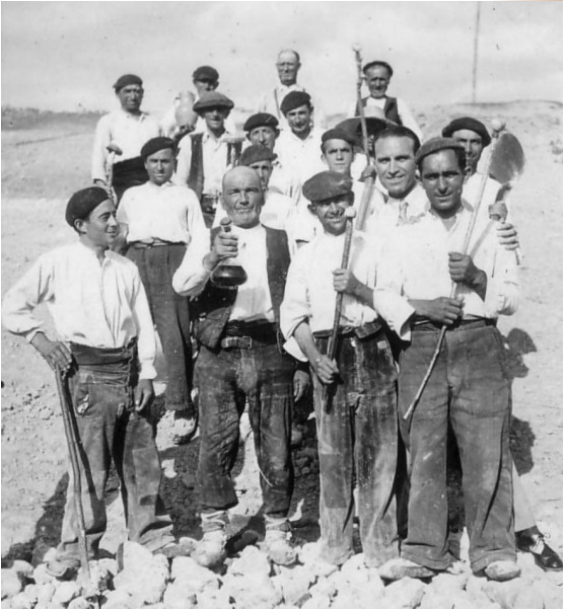
Grupo de hombres en una jornada de "Hacendera" en La Ventosilla, Barrio de San Pedro de Gaillos, 1944

La Revista del Centro de Interpretación del Folklore y la Cultura Popular Nº 10. El invierno, 2006