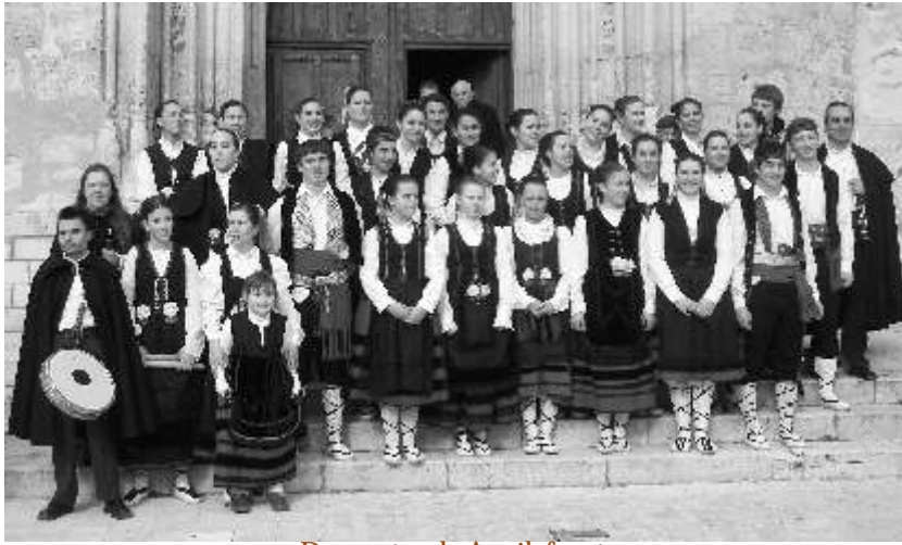
Danzantes de Aguilafuente

Al margen de crisis, corrupción y demás avatares nacionales, hay cosas como las tradiciones y las costumbres que ya antes sobrevivieron a guerras, enfermedades, hambre y otros problemas de la época. La antigüedad de los paloteos esta próxima al siglo XVI así los demuestran diversos temas como el paloteo del Carlos V, luego se fueron adaptando temas religiosos y bailes de la época, teniendo en cuenta que las danzas suelen ser canciones danzadas. En aquellos años en los que surgieron los paloteos, seguro que ante la necesidad de manifestar externamente la alegría y devoción que las fiestas religiosas les producían, y sin otras distracciones en las que emplear su tiempo, para algunos el “danzar o palotear” era un acontecimiento de los más importantes que recordarían en su vida, estas gentes crearon tradición, historia y folklore.