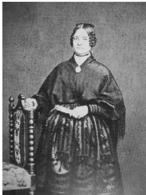
El antiguo peinado de rodetes laterales se complementa en los días grandes de fiesta con el complicado trenzado de la coleta dividida entre 9 a 33 cabos para confeccionar el moño de picaporte, que entretejido caracteriza a la segoviana.

Segovia conservó un variado y complejo entramado artístico en el uso de peinados y tocados: desde las monteras de Navafría, Turégano, Cantalejo, Cuéllar o Zamarramala, que tanto llamaron la atención a los escritores y fotógrafos de los siglos XIX y XX, peinados de múltiples y entreverados ramales de la trenzas segovianas hoy completamente descuidadas, complejos rodetes ensortijados a las sienes y adornados de