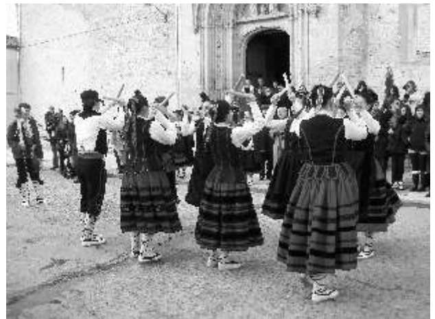
Danzantes de Aguilafuente, febrero 2013

Contamos en nuestros pueblos con gente capacitada para enseñar, transmitir y conservar este tipo de raíces y costumbres. No dejemos en manos de unos pocos una tarea que es de todos. ■