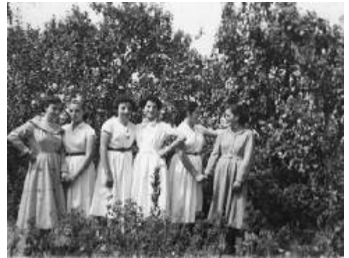
Mozas de San Pedro, años 60 del siglo XX

Para iniciar el tema consideramos importante hablar del momento en el que se iniciaban las primeras relaciones entre mozos y mozas, y más concretamente de los cambios que suponía el momento de convertirse en moza.