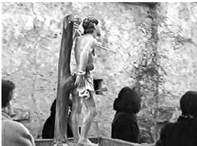
Rebollar, procesión de San Sebastián (talla de mediados del S. XX.)