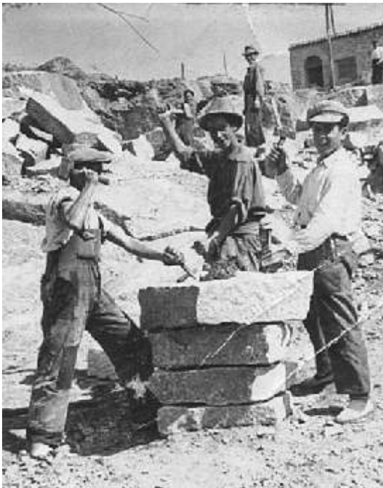
Canteros de San Lorenzo, 1951.