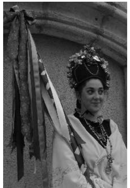
Mujer de Navafria, fiesta de San Sebastián.

“20 de enero. San Sebastián en Navafria. Navafria rememora en esta fecha a San Sebastián, jefe militar romano martirizado en tiempos de Diocleciano. Las principales protagonistas de la jornada son las mujeres. Ocho de ellas ejercen con simbólicos cargos militares y escoltan a la imagen del mártir, probablemente representando a aquellas otras mujeres que asistieron a San Sebastián en su padecimiento. Todas ellas son conocedoras de la condición que deben ocupar desde el 1 de enero, cuando el párroco anuncia en la eucaristía la lista de mujeres que formarán parte del séquito de San Sebastián. Cada una de ellas ha sido “echada” (designada) por la que desempeñó la misma función el año anterior. Las ocho simbolizan los tres estados de la vida (cuatro están casadas, dos son mozas y otras dos, niñas), y visten sus más preciadas indumentarias durante la jornada. Los cargos que ostentan las casadas reciben diferentes nombres: la quitavergüenzas, la capitana, la teniente capitana y la del palillo. De las solteras, las mozas son la de la bandera y la del cuchillón; y las niñas se llaman cabo primera y cabo segunda. Cada una de las ocho debe portar un atributo que la identifica (sable, palillo, bandera, cuchillón).”