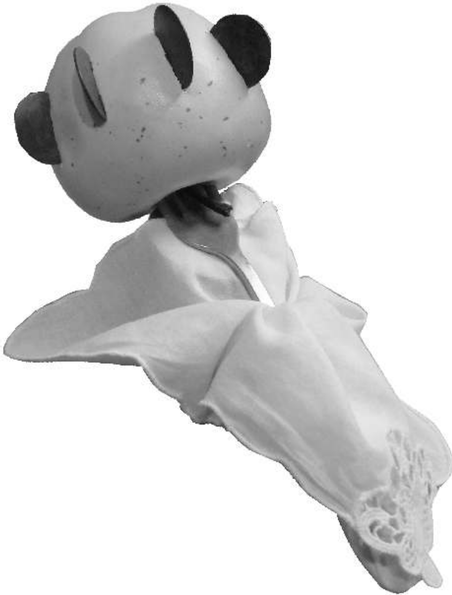
Manzana del Honor (rito de bodas) (Museo del Paloteo-Centro de Interpretación del Folklore)

La Revista del Centro de Interpretación del Folklore y la Cultura Popular Nº 38 El invierno, 2013