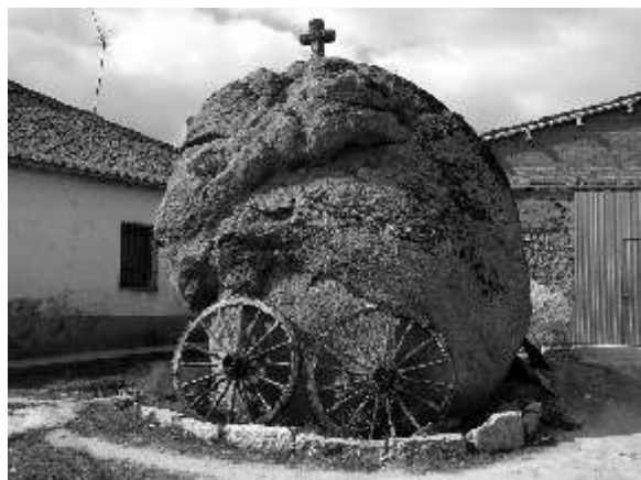
El Botón de Balisa, 2005.