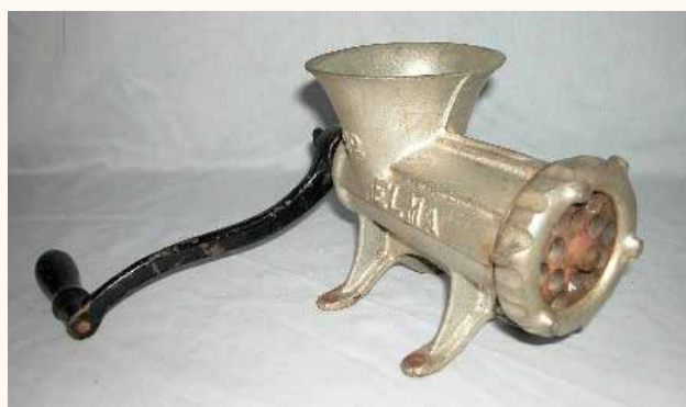
Foto 1: máquina de hacer chorizos. Col. Ismael, inventario G-002256

Muy corrientes en todas las cocinas rurales, este tipo de mesas bajas tenían un fin utilitario. Normalmente se usaban para elaborar los productos de la matanza, picar carne o hacer embutidos (Foto 1). En el diccionario de la Academia de 1899 aparece la voz “tocinera” (sin el término mesa) para designar: “tablón ancho y algo cóncavo, con apoyos o pies, donde se sala el tocino de las casas”. A partir de aquí, por asimilación, se denominó tocineras a estas mesas bajas. En documentos antiguos, en la literatura o en los diccionarios, no aparece nunca la voz “mesa tocinera”, de forma que nos inclinamos a pensar que es un término reciente. En algunos ámbitos se cree que