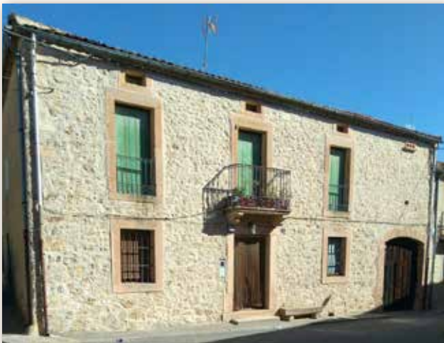
Casa del modelo B

En 1912, mis abuelos citados costearon la casa que aparece en la segunda imagen (modelo B); sita en la calle del Pozo. El cuerpo de la misma constaba de dos plantas habitables y un sobrado. La fachada principal daba a la calle y la puerta del corral se ubicaba en dicha fachada. En su pared lateral izquierda, se abrían dos ventanas para la iluminación y ventilación de la cocina y del cochedero.