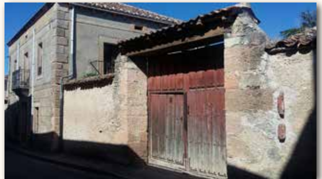
Casa del modelo A-B, poniente