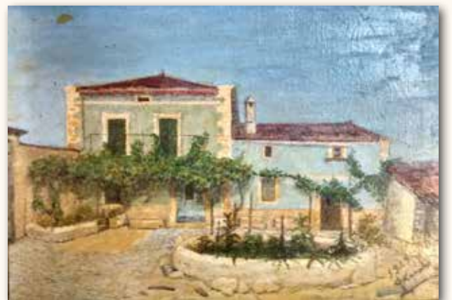
Casa del modelo A-B, mediodía

Para mis padres, la opción de sacar a la calle la puerta de entrada era obligada para el acceso del público a la farmacia. Pero nótese que en la misma calle –de Santiago-, con un total de catorce casas, se llevó a cabo la misma operación de reforma en otras cinco sin servicio público.