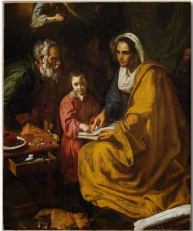
“La educación de la virgen”, atribuido a Diego Velázquez, 1617, Universidad de Yale. En la parte inferior izq. puede verse una mesa de este tipo.