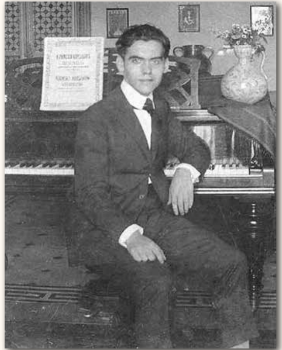
Federico García Lorca al piano 1919

La Tarara, sí; la tarara, no; la Tarara, niña, que la he visto yo.